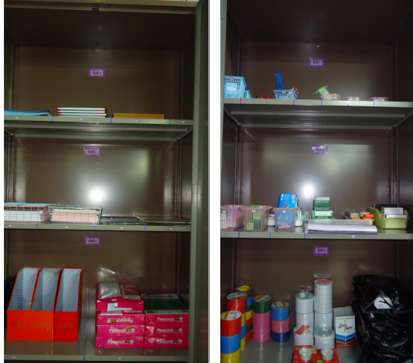
ภาพประกอบที่ 2 ตำแหน่งที่วางวัสดุอุปกรณ์

1. กำหนดตำแหน่งที่วางของวัสดุอุปกรณ์แต่ละรายการ ซึ่งแยกตามประเภทของวัสดุอุปกรณ์ สำหรับวัสดุอุปกรณ์ที่มีขนาดเล็กจะต้องมีภาชนะใส่ให้เรียบร้อย ดังภาพประกอบที่ 2