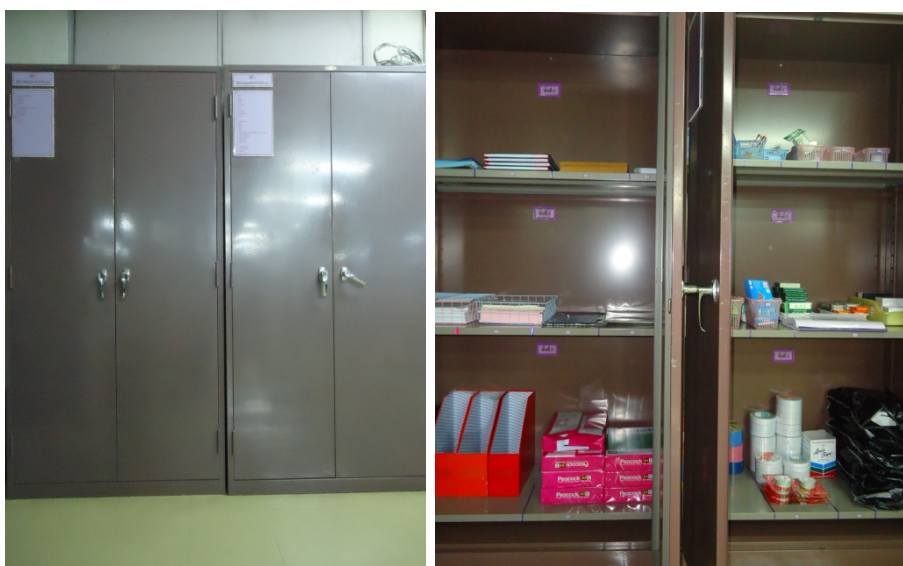
ภาพประกอบที่ 1 ตู้จัดเก็บวัสดุอุปกรณ์สำนักงาน

วัสดุอุปกรณ์ต่างๆ ประกอบด้วย วัสดุอุปกรณ์เครื่องเขียน วัสดุอุปกรณ์สำนักงาน วัสดุอุปกรณ์สำหรับซ่อมหนังสือ และวัสดุจำพวกกระดาษ โดยวัสดุอุปกรณ์ต่างๆเหล่านี้ได้ถูกจัดเก็บไว้ในตู้วัสดุอุปกรณ์อย่างเป็นกิจจะลักษณะ ดังภาพประกอบที่ 1