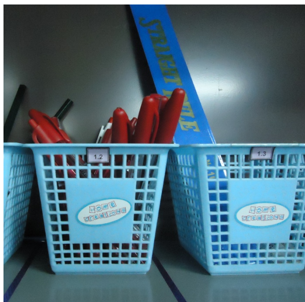
ภาพประกอบที่ 3 ตำแหน่งที่วางพร้อมหมายเลขกำกับ

2. ติดเส้นขอบเขตตำแหน่งที่วางและกำหนดหมายเลขของวัสดุอุปกรณ์แต่ละรายการ พร้อมทั้งติดหมายกำกับ ดังภาพประกอบที่ 3