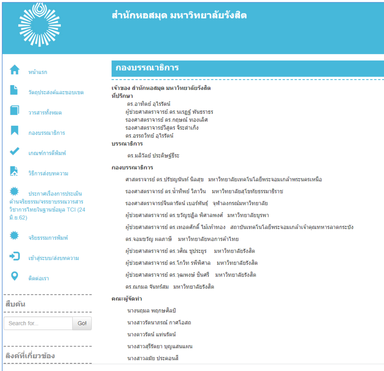
รูปที่ 5 เว็บเพจหน้ากองบรรณาธิการ

- เมนูของบรรณาธิการ ให้รายละเอียดเกี่ยวกับกองบรรณาธิการของวารสารรังสิตสารสนเทศ