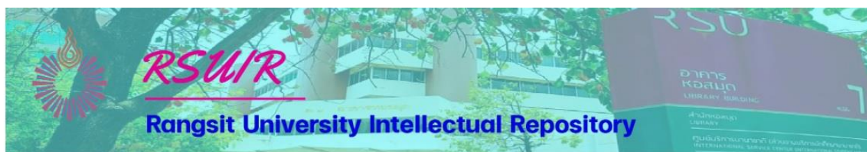
รูปที่ 7 แผนดำเนินงาน RSUIR