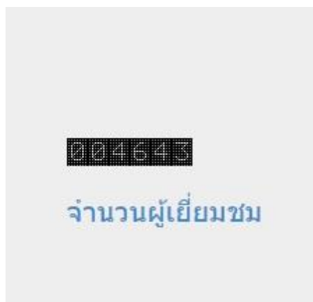
รูปที่ 4 จำนวนผู้เยี่ยมชม (Access)