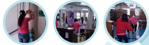
รูปที่ 3 จดหมายข่าวสำนักหอสมุดรายเดือน https://library.rsu.ac.th/library_newsletter.html

วันที่ 25 เมษายน 2567 เวลา 11.00 -12.30 น. สำนักหอสมุดฝึกปฏิบัติซ้อมอพยพหนีไฟ ประจำปีการศึกษา 2566 เพื่อให้บุคลากรได้เข้าใจขั้นตอนในการอพยพหนีไฟเมื่อเกิดเพลิงไหม้ในอาคาร