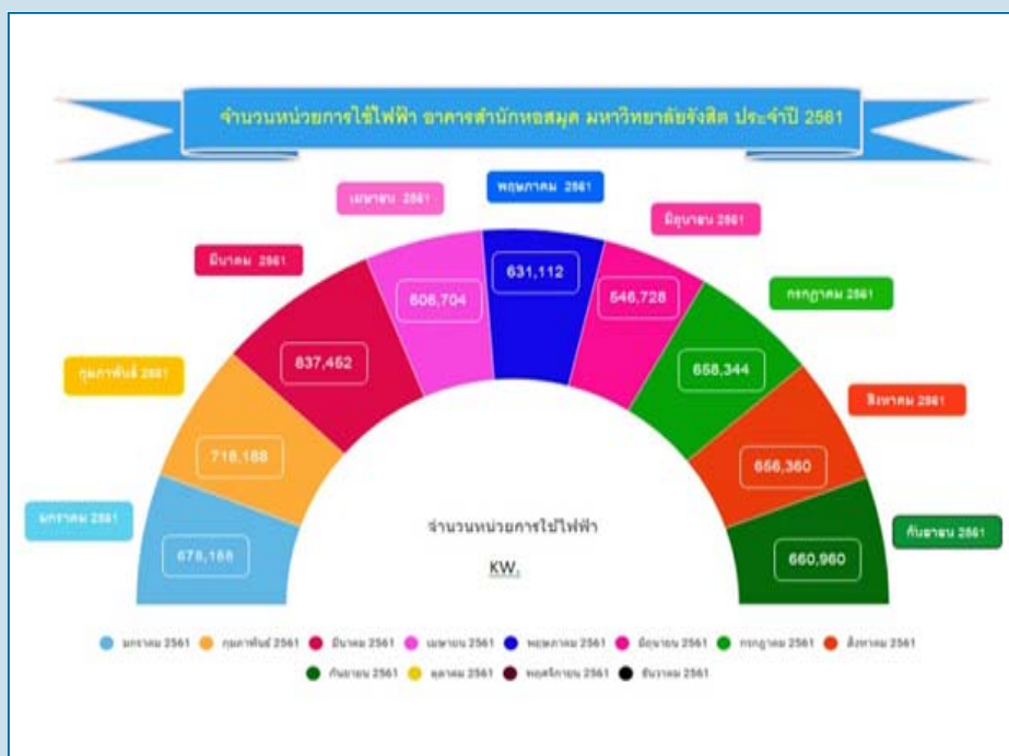
ภาพรวมการใช้พลังงานและทรัพยากร เดือนมกราคม – กันยายน 2561

แนวทางที่สำนักหอสมุดนำมาใช้คือ การกำหนดมาตรการประหยัด ลดการใช้พลังงาน และการอนุรักษ์พลังงานควบคู่ไปกับการใช้มาตรการประหยัด ลดรายจ่าย ลดการใช้พลังงานของมหาวิทยาลัยรังสิต ประจำปีการศึกษา 2560 เพื่อให้บุคลากรถือปฏิบัติและถ่ายทอดสู่ผู้ใช้บริการของห้องสมุดซึ่งจะก่อให้เกิดเป็นผลลัพธ์ที่ดีโดยรวม